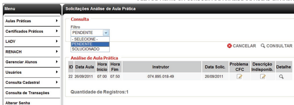
TELA DE FILTRO DA CONSULTA DE ANÁLISE DE AULAS ENVIADAS

Passo 3. Depois de escolher o filtro desejado, clique em Consultar .