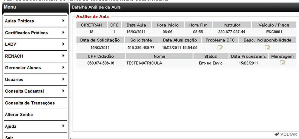
TELA DE DEMONSTRAÇÃO DO FILTRO DE CONSULTA DE AULAS SOLUCIONADAS

Passo 9. O sistema apresentará o detalhamento das aulas enviadas, inclusive o status em que se encontram: Solucionado ou Erro de Envio . No caso de Erro de Envio , a mensagem de retorno do sistema poderá ser vista posicionando-se o mouse sobre o ícone na coluna Mensagem .