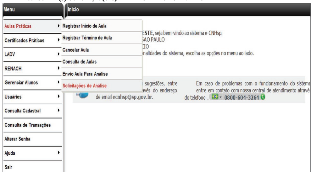
TELA DE CONSULTA À(S) SOLICITAÇÃO(ÕES) DE ANÁLISE DE AULAS ENVIADAS

Passo 2. O Diretor de Ensino pode filtrar a consulta das aulas enviadas selecionando Pendente ou Solucionado .